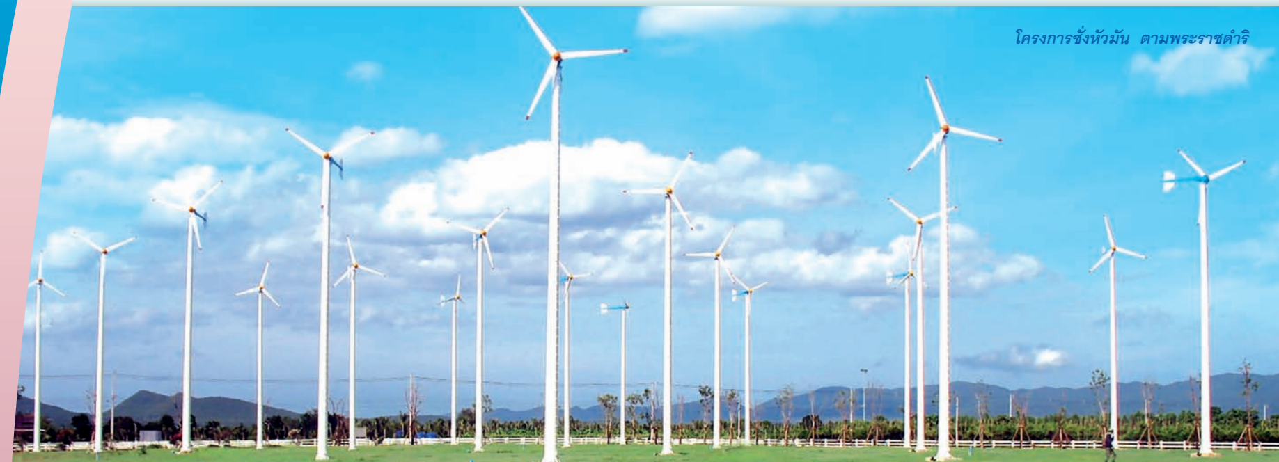
โครงการชั่งหัวมัน ตามพระราชดำริ

๖ เดือนตุลาคมนี้เป็นการเริ่มต้นงานสำหรับปีงบประมาณใหม่ในระบบราชการ ในส่วนของสำนักงาน กปร. เรามีงานในหลาย ๆ เรื่องที่เราต้องทำต่อเนื่องจากปีที่ผ่านมาและมีงานใหม่ที่วางแผนที่จะดำเนินงานกันเพื่อให้โครงการอันเนื่องมาจากพระราชดำริสามารถสร้างความอยู่ดีมีสุขให้แก่ราษฎรในพื้นที่ต่าง ๆ ได้อย่างมีประสิทธิภาพ